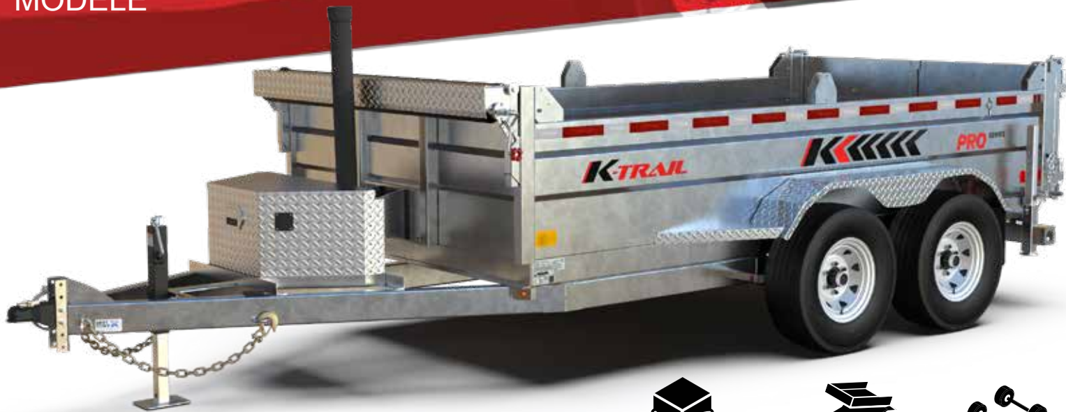
D612-10-PS illustré sujet à changement