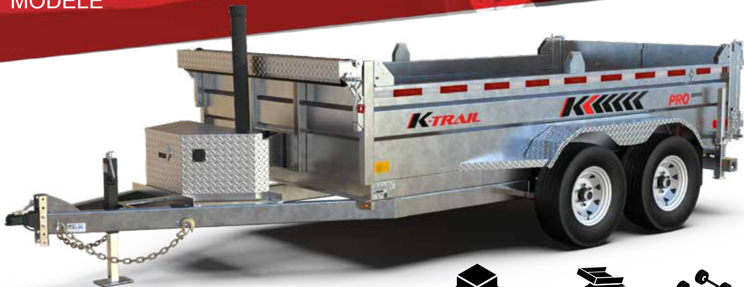
D612-10-PS illustré sujet à changement