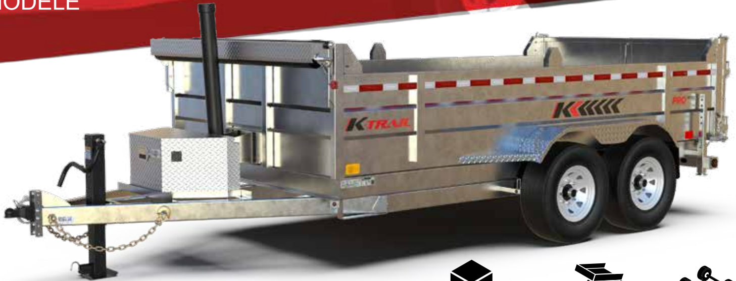
D8212-14-PS-20 illustré sujet à changement