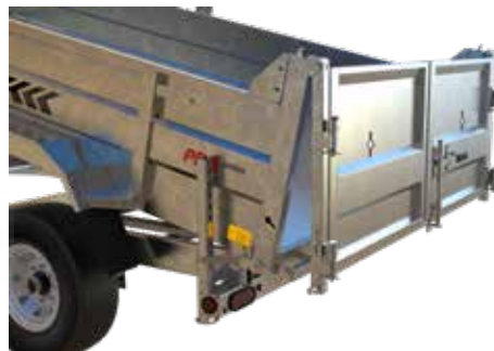
PORTES À SABLE DOUBLE ACTION