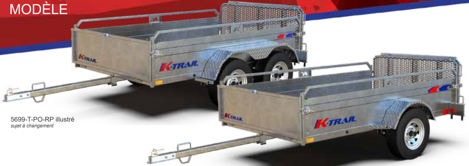
5699-T-PO-RP illustré sujet à changement