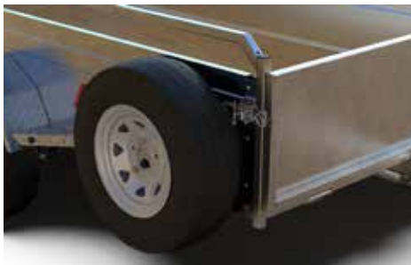
ROUE DE SECOURS