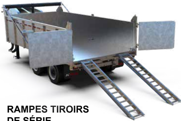
RAMPES TIROIRS DE SÉRIE