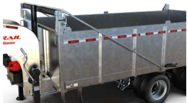
BRAS DE TOILE AVEC RESSORT