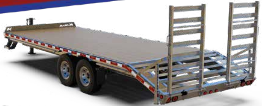
DKO20-3-14 illustré sujet à changement