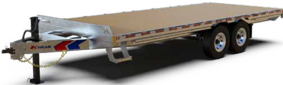
DKO20-14 illustré sujet à changement