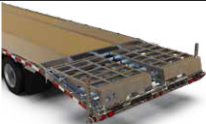
PLATEAU AVANT 8 PI X 8 PI