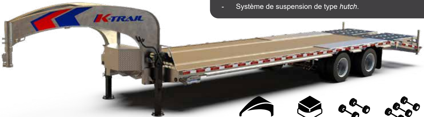
GN25-5LHT30HR40-01-22 illustré sujet à changement