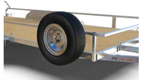
ROUE DE SECOURS