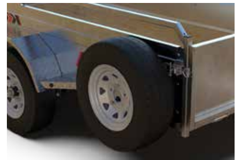
ROUE DE SECOURS