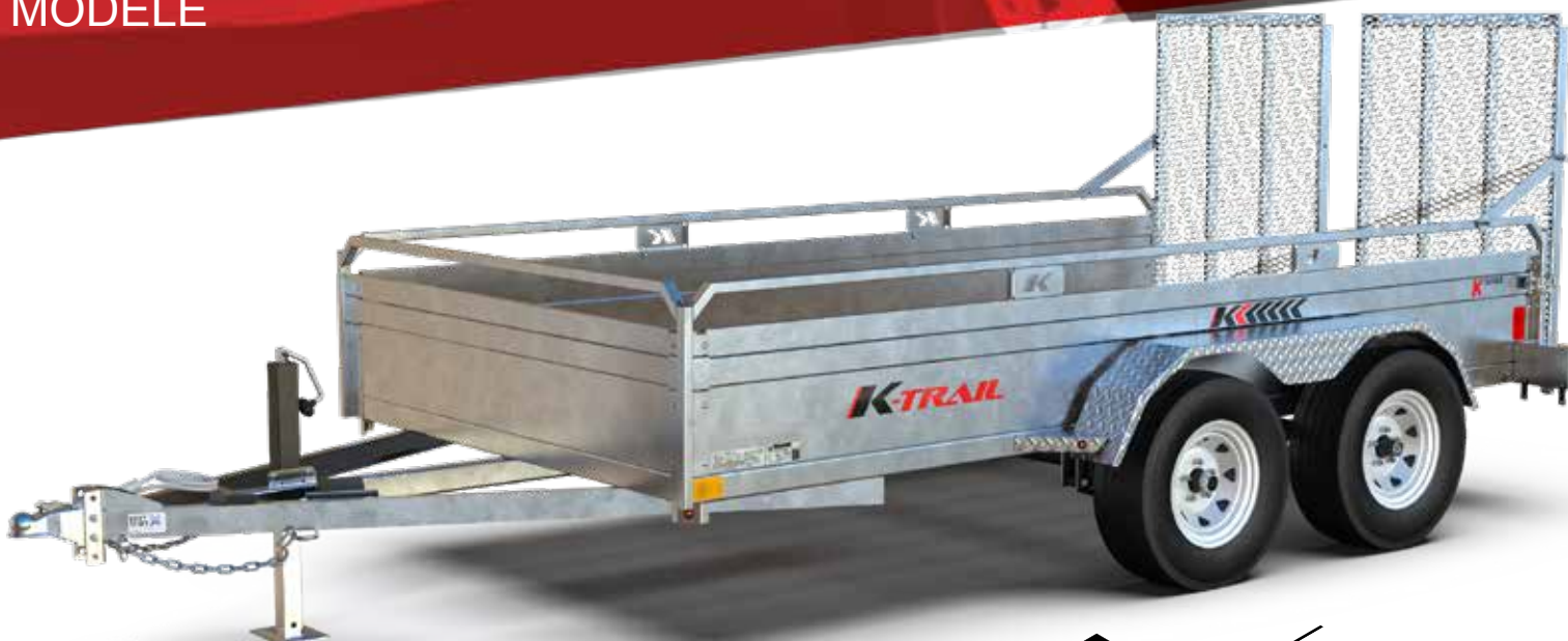
72144-T-EB-SR illustré sujet à changement