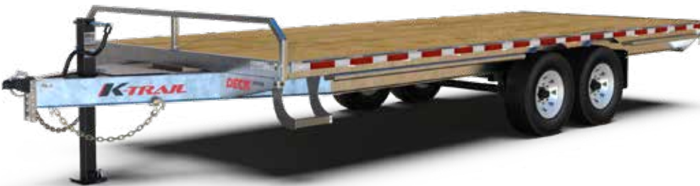
DKO20-14 illustré sujet à changement