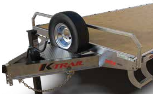
SUPPORT À PNEU DE SECOURS INTÉGRÉ