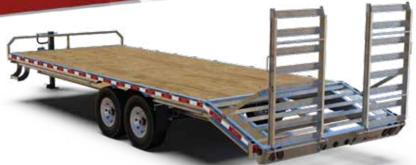
DKO20-3-14 illustré sujet à changement