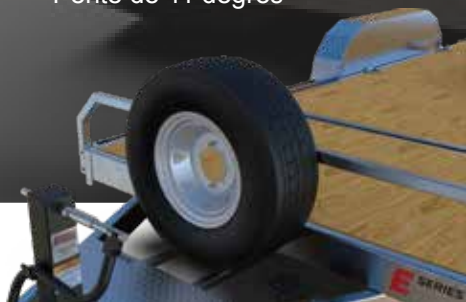
ROUE DE SECOURS À L'AVANT (MODÈLE GRAVITÉ)