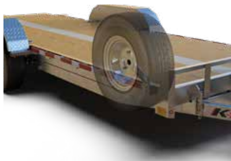
ROUE DE SECOURS (MODÈLE HYDRAULIQUE)