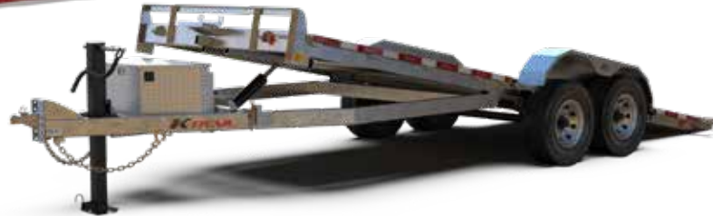
TI8020-14 illustré sujet à changement