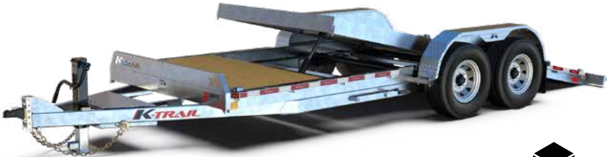
TI8216-4-14 illustré sujet à changement