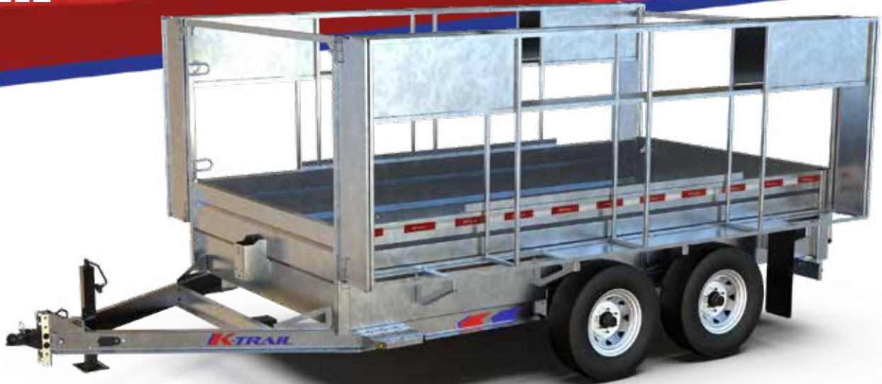
E72146-10-K1 illustré sujet à changement